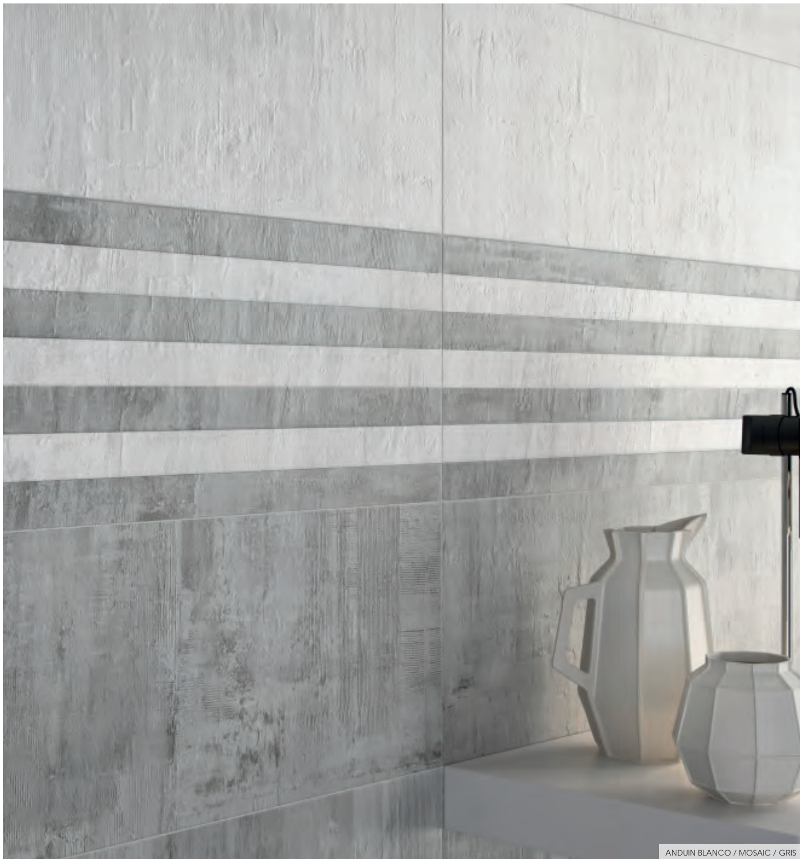
ANDUIN BLANCO / MOSAIC / GRIS