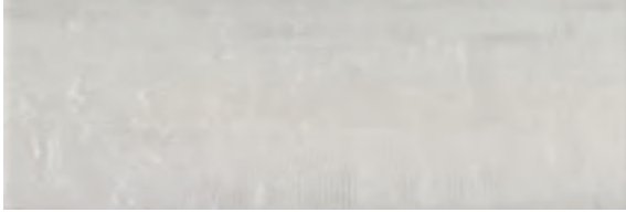
ANDUIN Blanco 25x75 · 9,8" x 29,5" RR0304