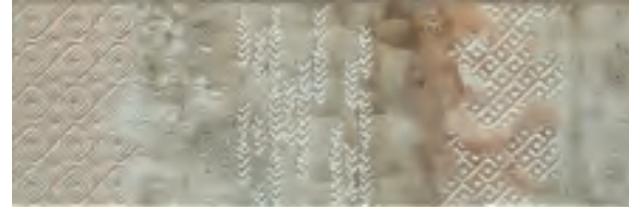
Decorado ANDUIN 25x75 · 9,8" x 29,5"