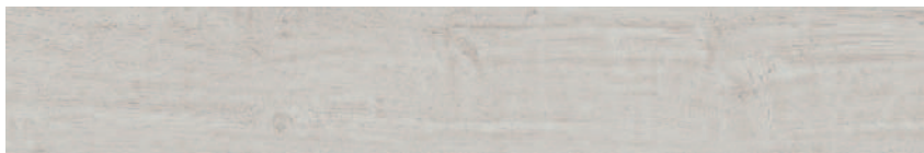
SG731500R Меранти белый обрезной 13x80 Meranti white rectified