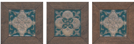
ID60 Меранти венге мозаичный 13x13 Meranti wenge mosaic