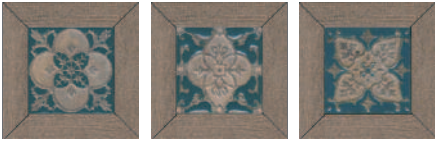
ID62 Меранти пепельный мозаичный 13x13 Meranti ash-grey mosaic