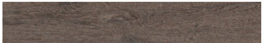
SG732100R Меранти венге обрезной 13x80 Meranti wenge rectified