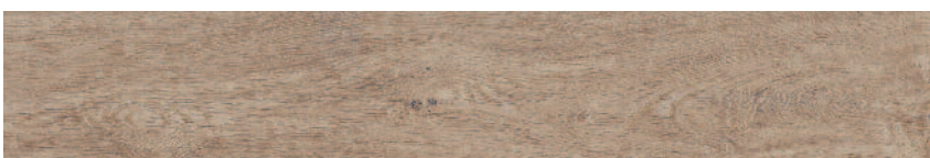
SG731800R Меранти Меранти пепельный светлый обрезной 13x80 Meranti ash-grey light rectified