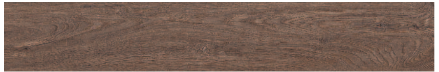
SG731700R Меранти беж темный обрезной 13x80 Meranti dark beige rectified