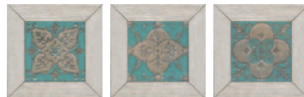
ID57 Меранти белый мозаичный 13x13 Meranti white mosaic