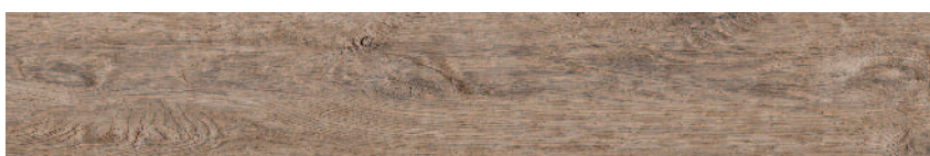
SG731600R плинтус Меранти беж обрезной 13x80 Meranti beige rectified