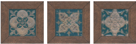
ID59 Меранти беж темный мозаичный 13x13 Meranti dark beige mosaic