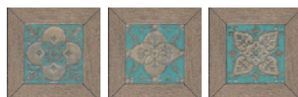
ID58 Меранти беж мозаичный 13x13 Meranti beige mosaic