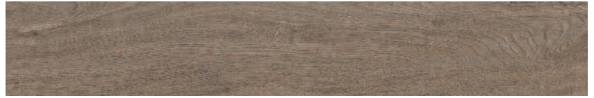
SG731900R Меранти пепельный обрезной 13x80 Meranti ash-grey rectified