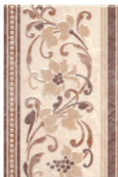
HGD/A01/8245 Вилла Флоридиана 20x30 Villa Floridiana