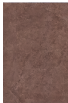
8247 Вилла Флоридиана коричневый 30x30 Villa Floridiana brown