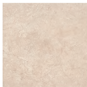
SG917900N Вилла Флоридиана беж светлый 30x30 Villa Floridiana light beige