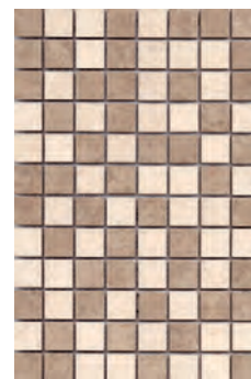
MM8254 Вилла Флоридиана мозаичный 20x30 Villa Floridiana mosaic