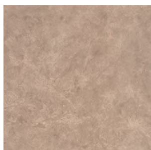
SG918000N Вилла Флоридиана беж 30x30 Villa Floridiana beige