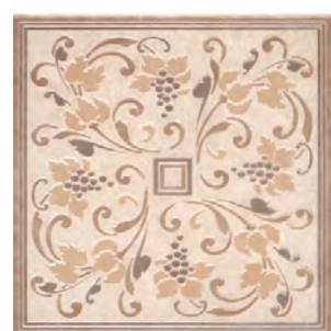
HGD/A42/SG9179 Вилла Флоридиана 30x30 Villa Floridiana