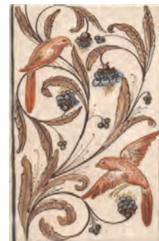
FC/A10/8245 Вилла Флоридиана 20x30 Villa Floridiana