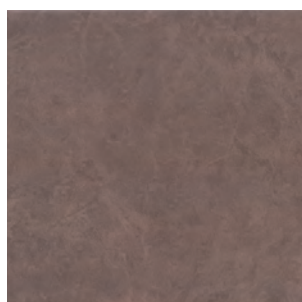
SG918100N Вилла Флоридиана коричневый 30x30 Villa Floridiana brown